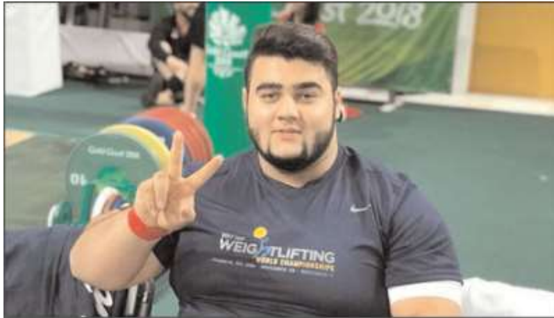
Pakistan weightlifter Nooh Dastagir Butt poses for a photograph on Monday.