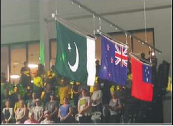
کامن ویلتھ گیمز کے ویٹ لفٹنگ ایونٹ میں برنز میڈل جیتنے پر پاکستانی پرچم اٹھا رہا ہے، دوسری جانب نوح سنگھ کو کوزی ٹینڈ پر.....